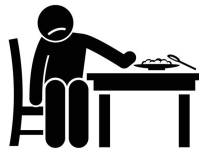
Pérdida del Apetito