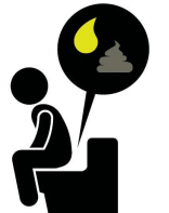
Orina oscura, heces pálidas, y diarrea

Si usted piensa que pudiera estar padeciendo de la Hepatitis A, acuda a su médico o a la sala de urgencias más cercana. Siempre lávese las manos con agua y jabón después de usar el baño o cambiar pañales y antes de entrar en contacto con alimentos.